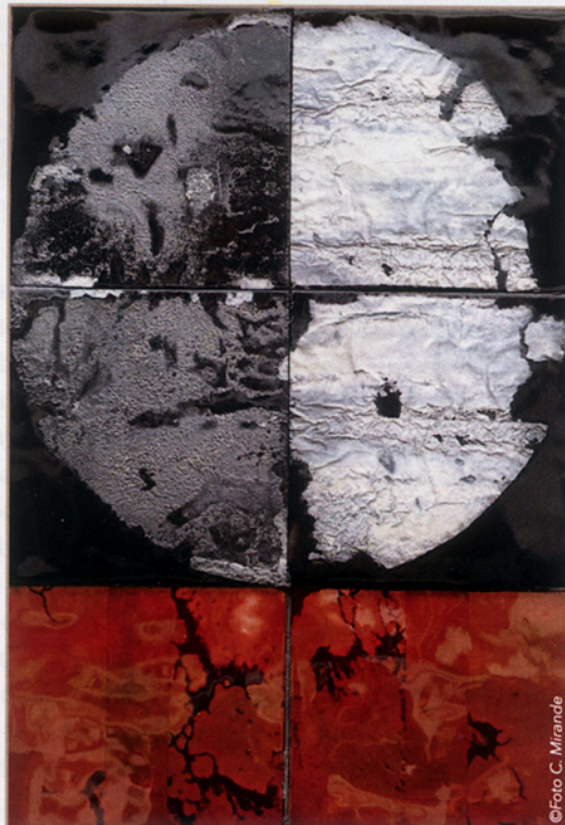
"Constellation Familiale" Esmalts s/coure arrugat 57x40 cm. 2021. Coll. privada