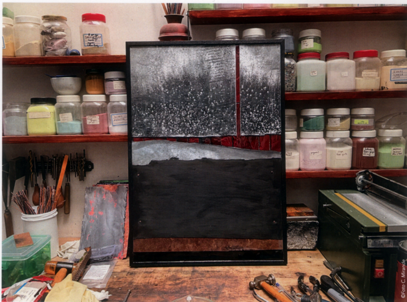
"Paysages de Poméranie" / Esmalt al foc sobre coure (57 x 40 cm) 2023.

sentan 25 obras, 10 de las cuales se han creado expresamente. Las otras son anteriores, pero se han escogido por estar en la línea del nuevo tema.